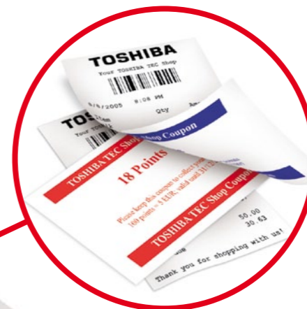
Économisez du papier et créez des promotions avec l'imprimante thermique double face TRST-A15